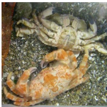
オオヒロバオオギガニの脱皮。脱皮殻(上)と脱皮したてのきれいな個体(下)

節足動物は体の外側をクチクラという硬い膜で覆われています。このため成長するには、きゆうくつになったクチクラを脱がねばなりません。これが脱皮です。