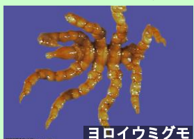
ヨロイウミグモ ウミグモ類