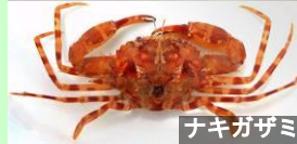
ナキガザミ 十脚類