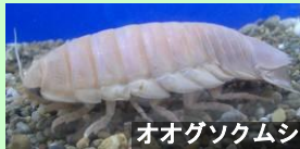
オオグソクムシ 等脚類