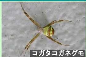
ヨガタコガネグモ クモ形類