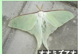
オオミズアオ 昆虫類