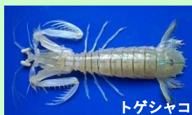
トゲシャコ シャコ類