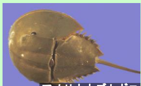
アメリカカブトガニ カブトガニ類