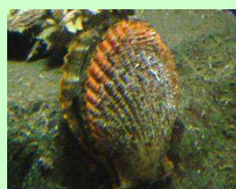
にまいがいこう 二枚貝綱