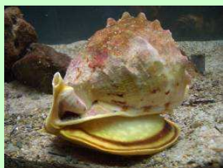
ふくそくこう まきがい 腹足綱：巻貝・ウミウシの仲間