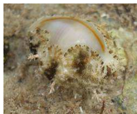
ハナビラダカラ 外套膜で貝殻を覆っ ている