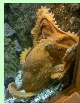
とうそくこう 頭足綱： イカ・タコの仲間