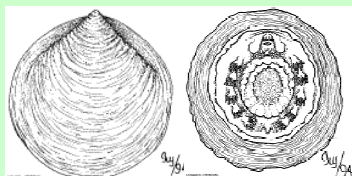
たんばんこう 単板綱