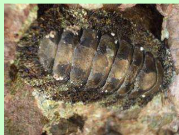
たばんこう 多板綱： ヒザラガイの仲間