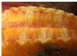
がいとうまく ヒオウギの外套膜 ならんでいる青い点 はすべて目

なんたいどうぶつ おお かた かいがら も やわ 軟体動物の多くは硬い貝殻を持っており、柔 らかい体を包み込んで身を守っています。貝 がら がいとうまく よ まかん ぶんびつ 殻は外套膜と呼ばれる器官から分泌されま す。ホタテガイの「貝ひも」や、イカの胴の食 用にする部分がこれにあたります。