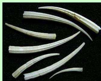
くつそくこう 掘足綱： ツノガイの仲間